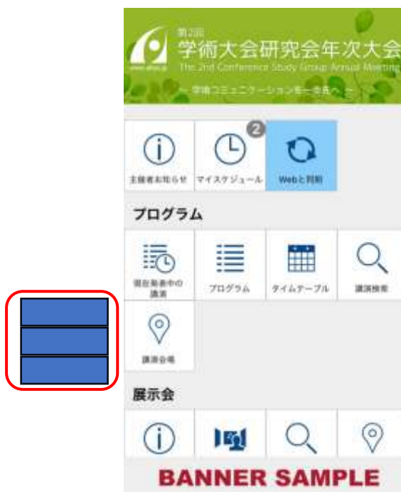
サイズ px : 高さ 210×幅 1,536