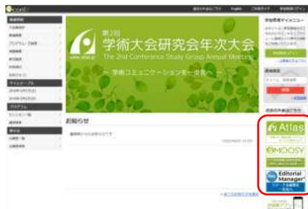
サイズ px : 高さ 80×幅 160