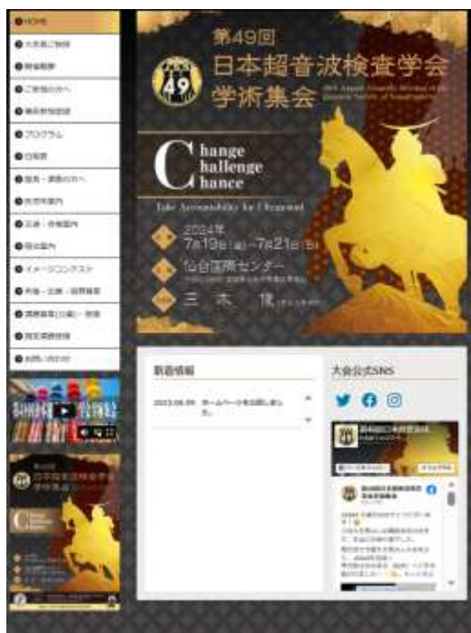
サイズ px : 高さ 70×幅 210